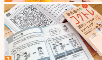
1 さまざまな療育教材。視覚注意、視覚 推理、視空間認知などの能力を育み、学習 の土台を形成する。2 ゲーム感覚で楽し く学べる。3 認知機能強化トレーニング の教材。